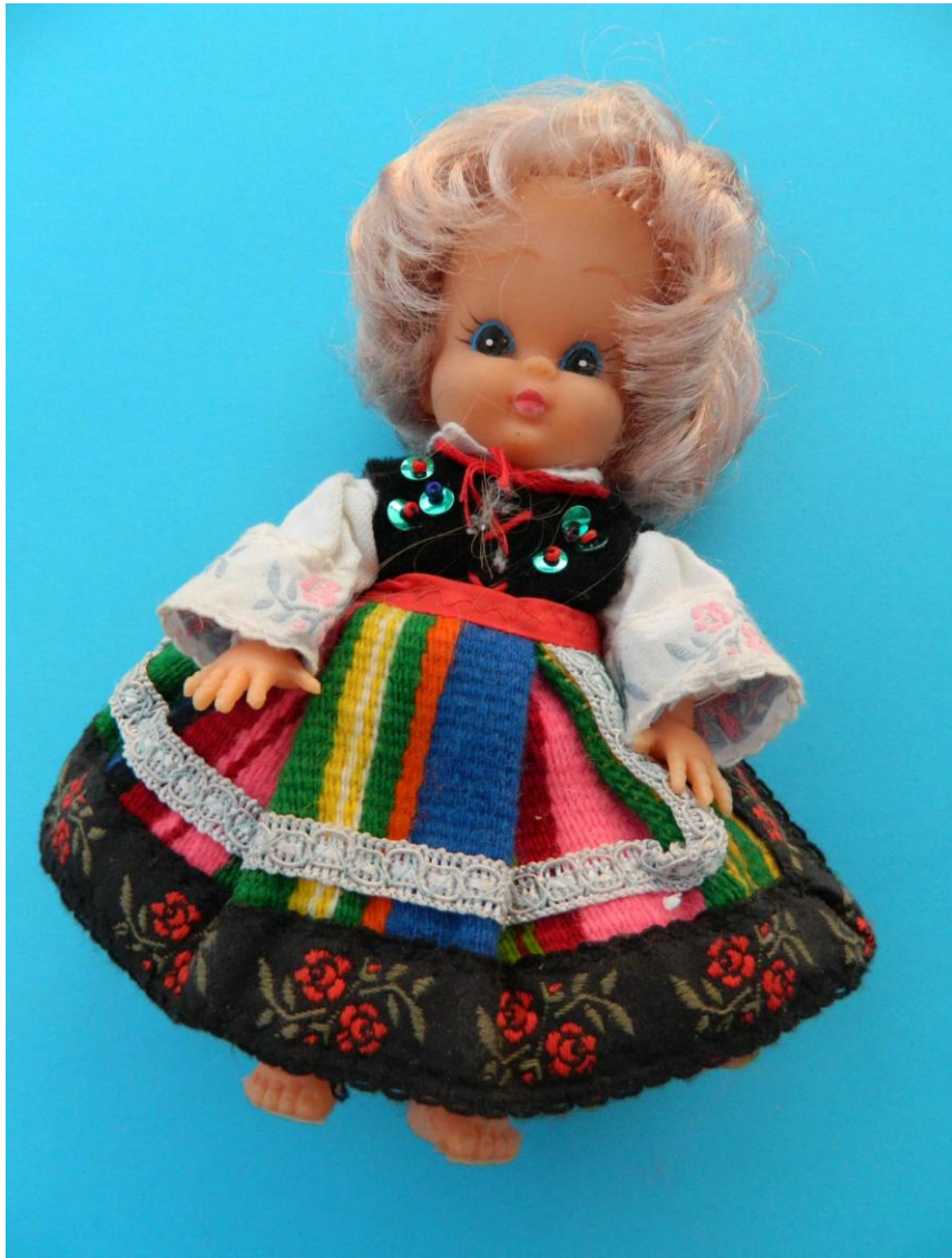
lalka w stroju krakowskim