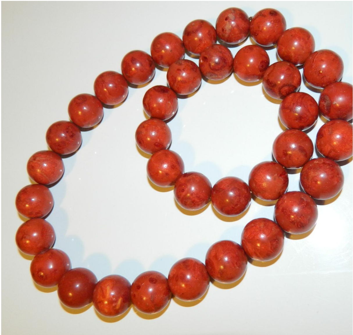
korale- element stroju krakowskiego