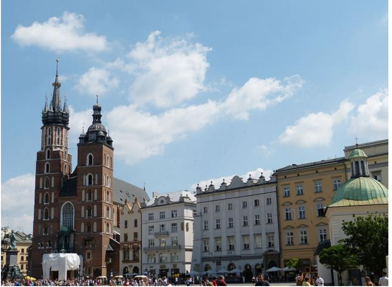
Stare Miasto, Kościół Mariacki