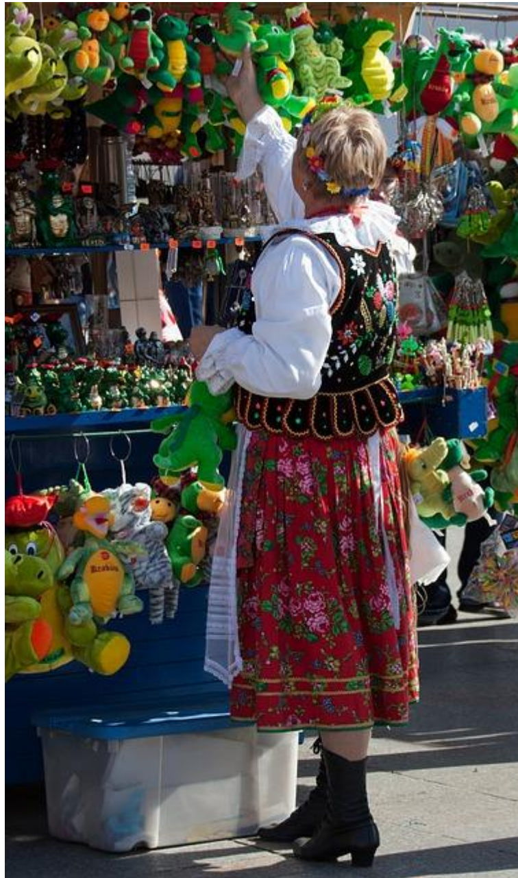
stragany na krakowskim Rynku, krakowski strój