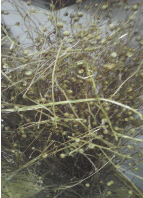
załącznik nr 2