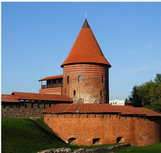
ZAMEK W KOWNIE