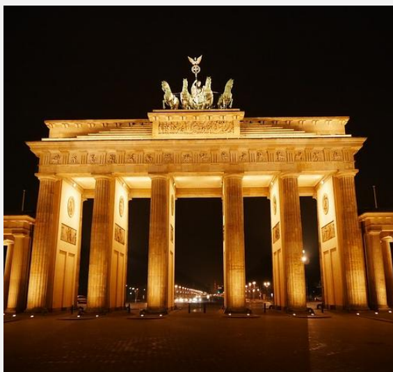
ŁUK TRUMFALNY W BERLINIE