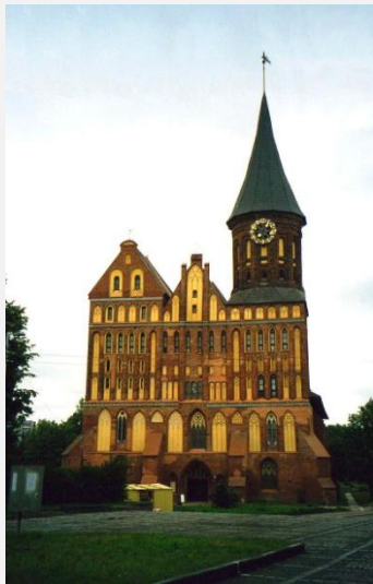
KOŚCIÓŁ ŚW. WOJCIECHA I NAJSWIĘTSZEJ MARIJ PANNY W KALININGRADZIE