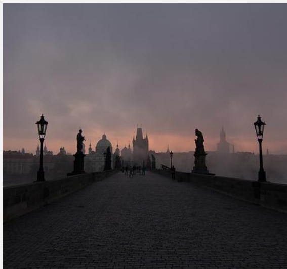
MOST KAROLA W PRADZE