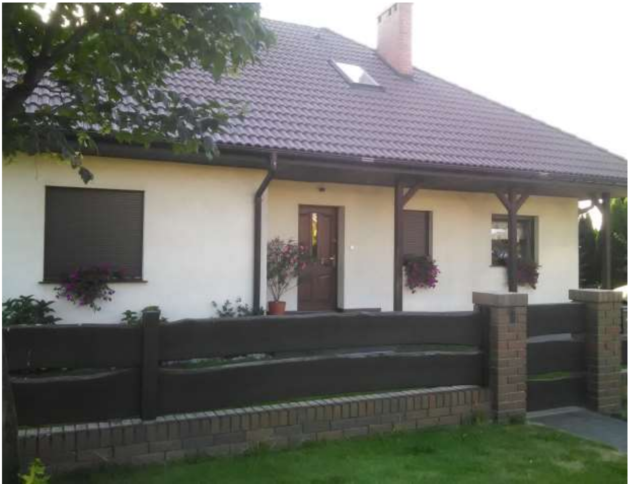
Załącznik 2 (do tematu My family. )